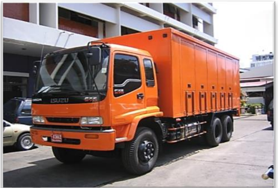
รถบริการซ่อมบำรุง (Maintenance Truck)

ความจำเป็นที่ทางแต่ละหน่วยงานจำเป็นต้องมีรถ Service Truck ไว้ใช้งานเพื่อความสะดวก, รวดเร็วในการให้บริการ รวมถึงลดค่าใช้จ่ายในการจ้างซ่อมบำรุง