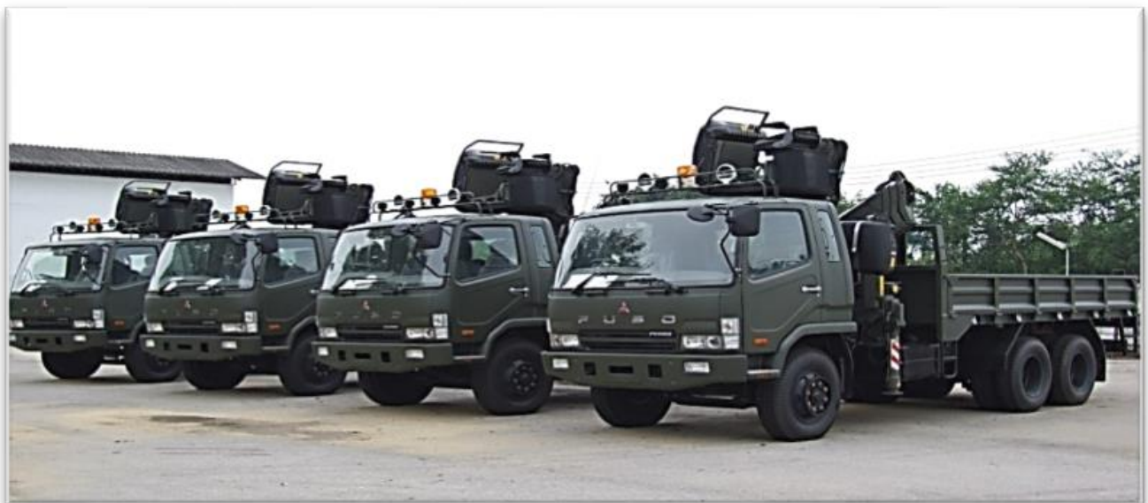
รถเครน (Crane Truck)