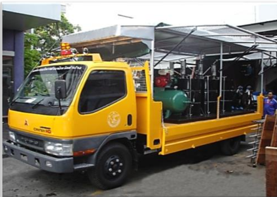
รถบริการน้ำมันหล่อลื่น (Lube Truck)